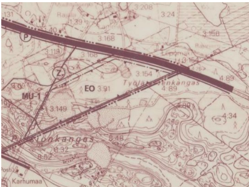
Kuva 1. Ottamisalue sijoittuu Pinsiönkankaan osayleiskaavassa EO-alueelle. https://www.hameenkyro.fi/site/assets/files/6016/178879-pinsi_c3_b6_a0.pdf

Hämeenkyrön puolella alueella on voimassa ympäristöministeriön vuonna 1985 vahvistama Pinsiönkankaan osayleiskaava, jossa ottamisalue sijoittuu EO-alueelle.