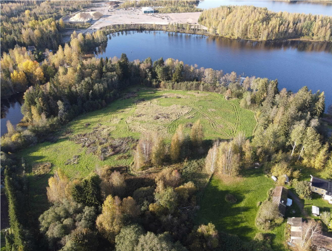
Kaava-alueen viistokuva kaakosta. Vasemmalla Pappilanjoki, alaoikealla Yli-Niskalan tila, taustalla Timinsaari.