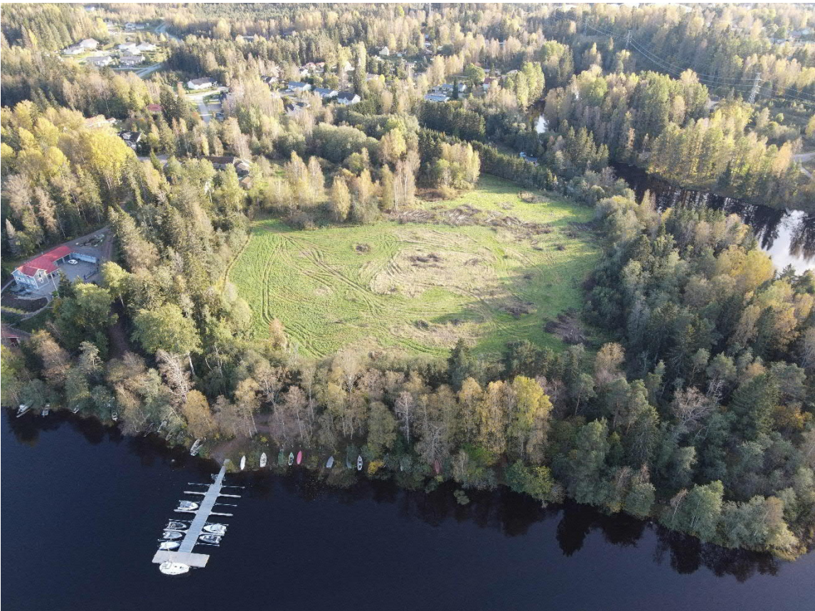
Kaava-alueen viistokuva luoteesta. Edustalla Kyröskosken venesatama, taustalla Pappilan joki, Käpylä ja Selvaagin alue.