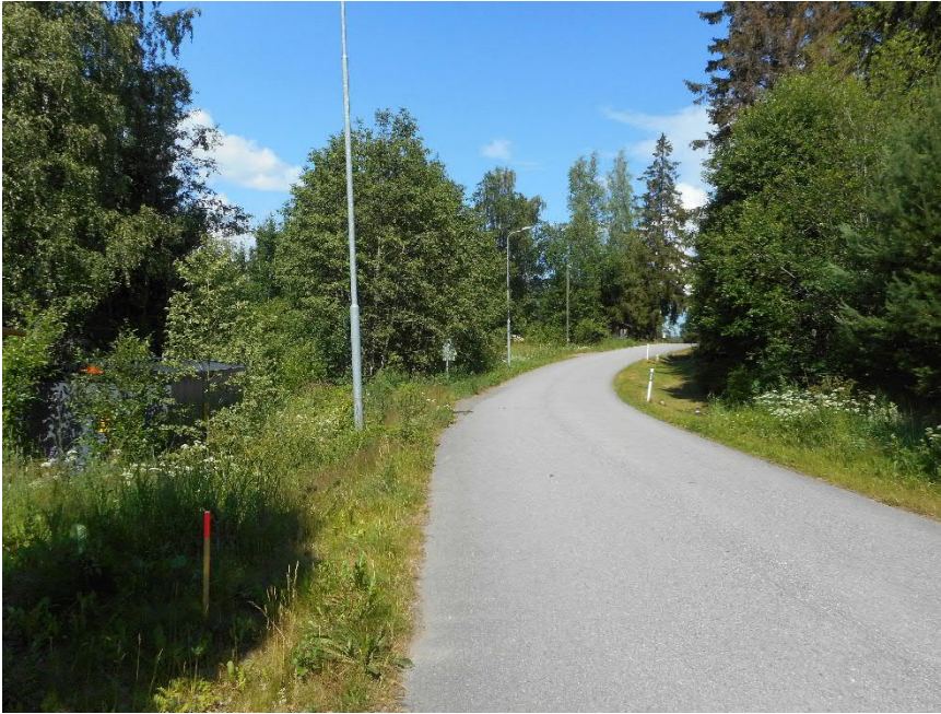
Saapuminen alueelle, Laivataival -tie pohjoiseen. Uusi tonttikatu kääntyisi vasemmalle.