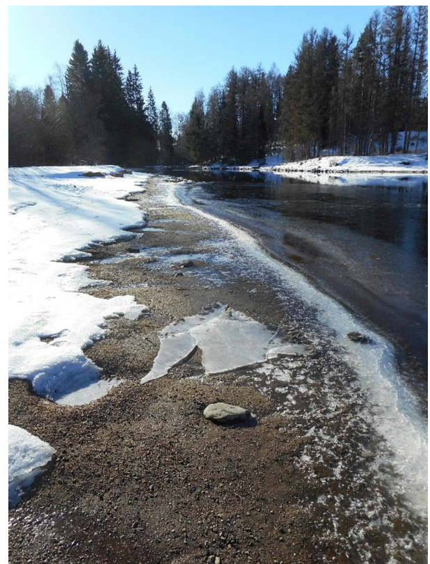
Pappilanjoki ja joenvarren ulkoilupolku.