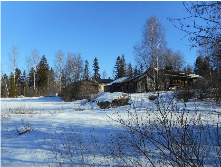
Yli-Niskalan tila lounaasta.