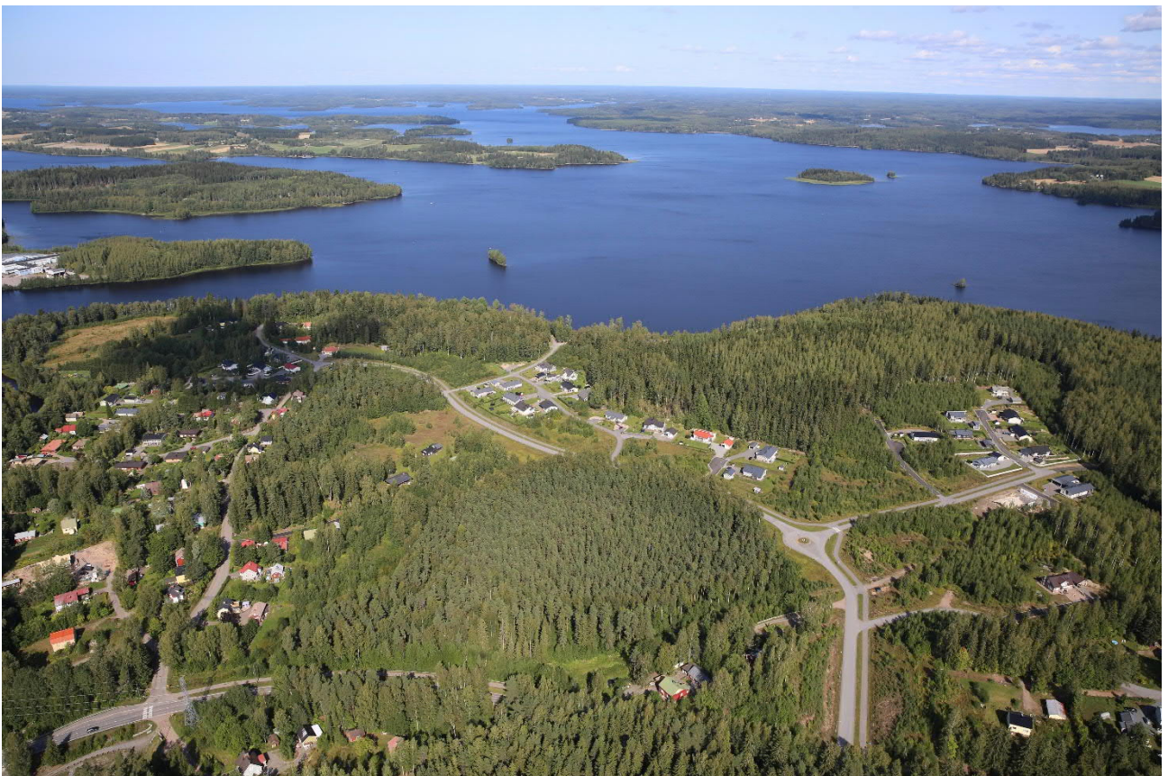
Ranta-Niskalan alue kuvan keskellä vasemmalla, ajoneuvoliikenne alueelle tapahtuu oikealta Niskalantietä pitkin