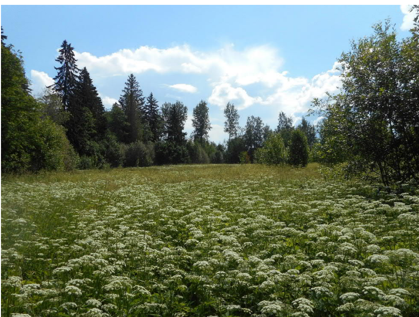
Vanha pelto, taustalla Yli- Niskalan tila.