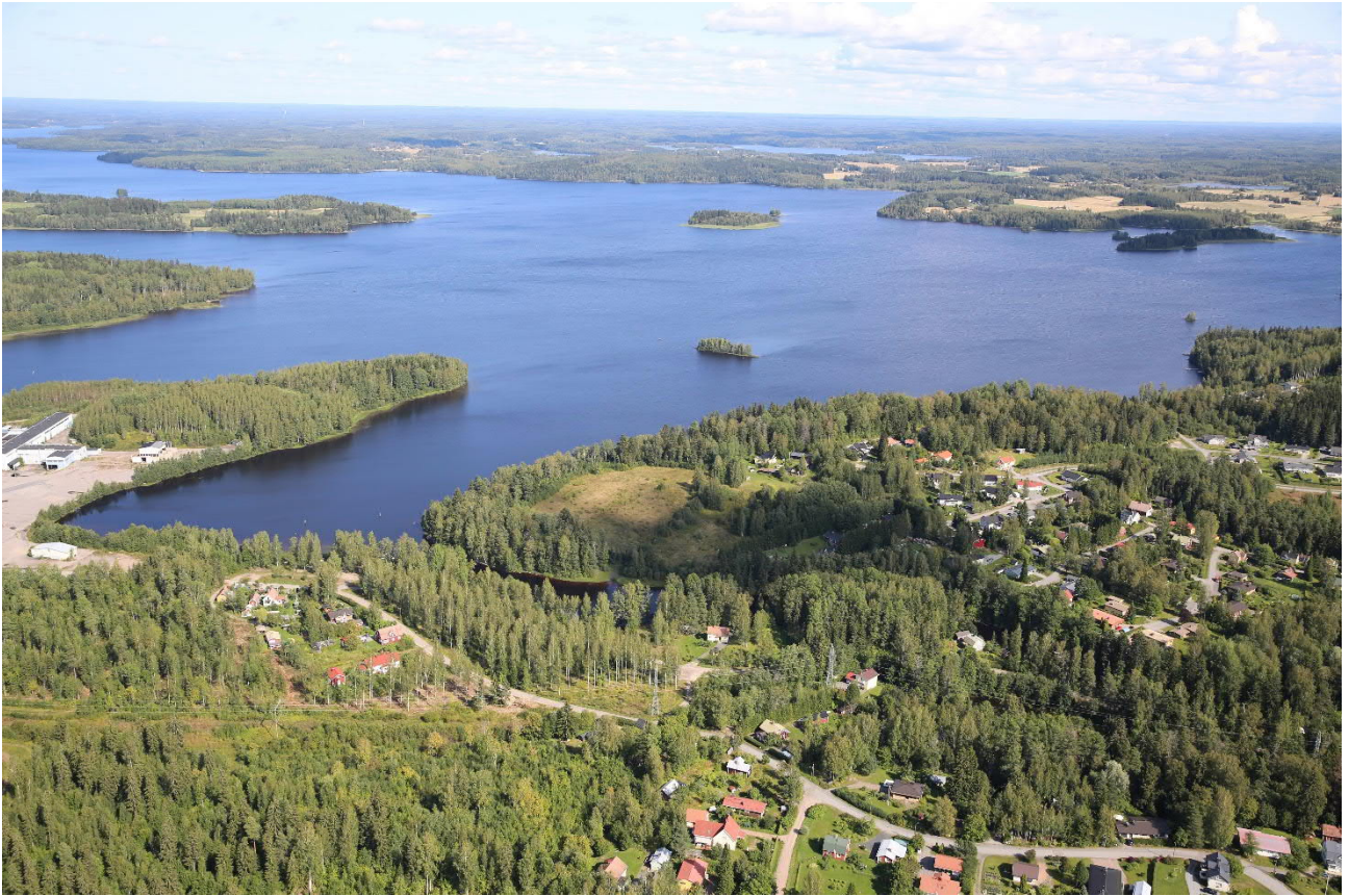
Ranta-Niskalan alue keskellä kuvaa, edustalla Selvaagin alue ja Pappilanjoki, taustalla Kyrösjärvi